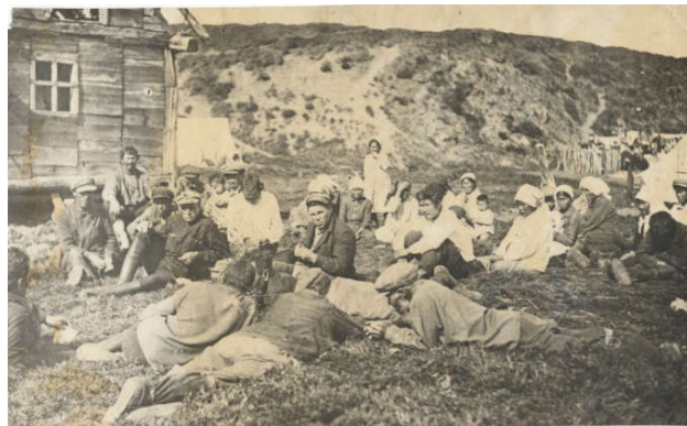
Паланы кочевой в оседлую Палану. С этого

17 июня 1939 года на общем собрании с. Палана кочевая приняла решение о переселении