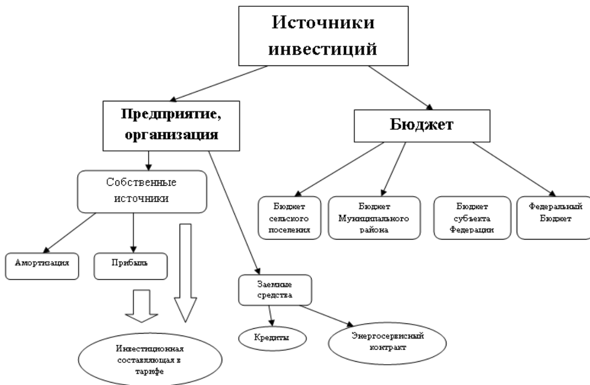
Рис. 4. Структура инвестиций

В рассматриваемой схеме теплоснабжения анализируются инвестиционные проекты, по которым могут осуществлять финансирование хозяйствующие субъекты различной отраслевой и муниципальной принадлежности. В общем случае источники инвестиций на реализацию мероприятий, предусмотренными данными инвестиционными проектами можно изобразить следующим образом (Рис. 4).