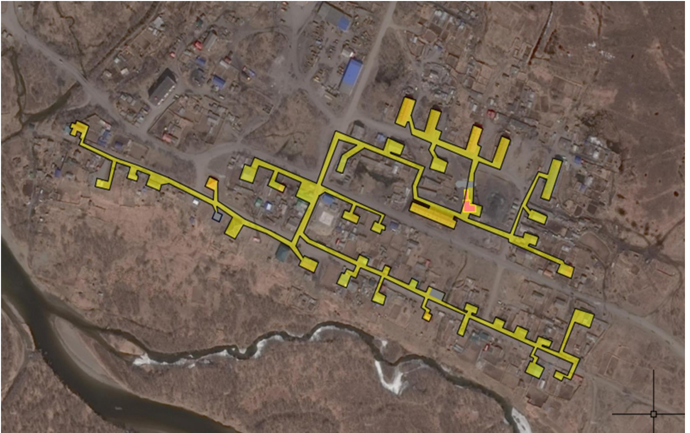
Рис. 1.2 – Зона действия котельной «Совхозная» – пгт Палана