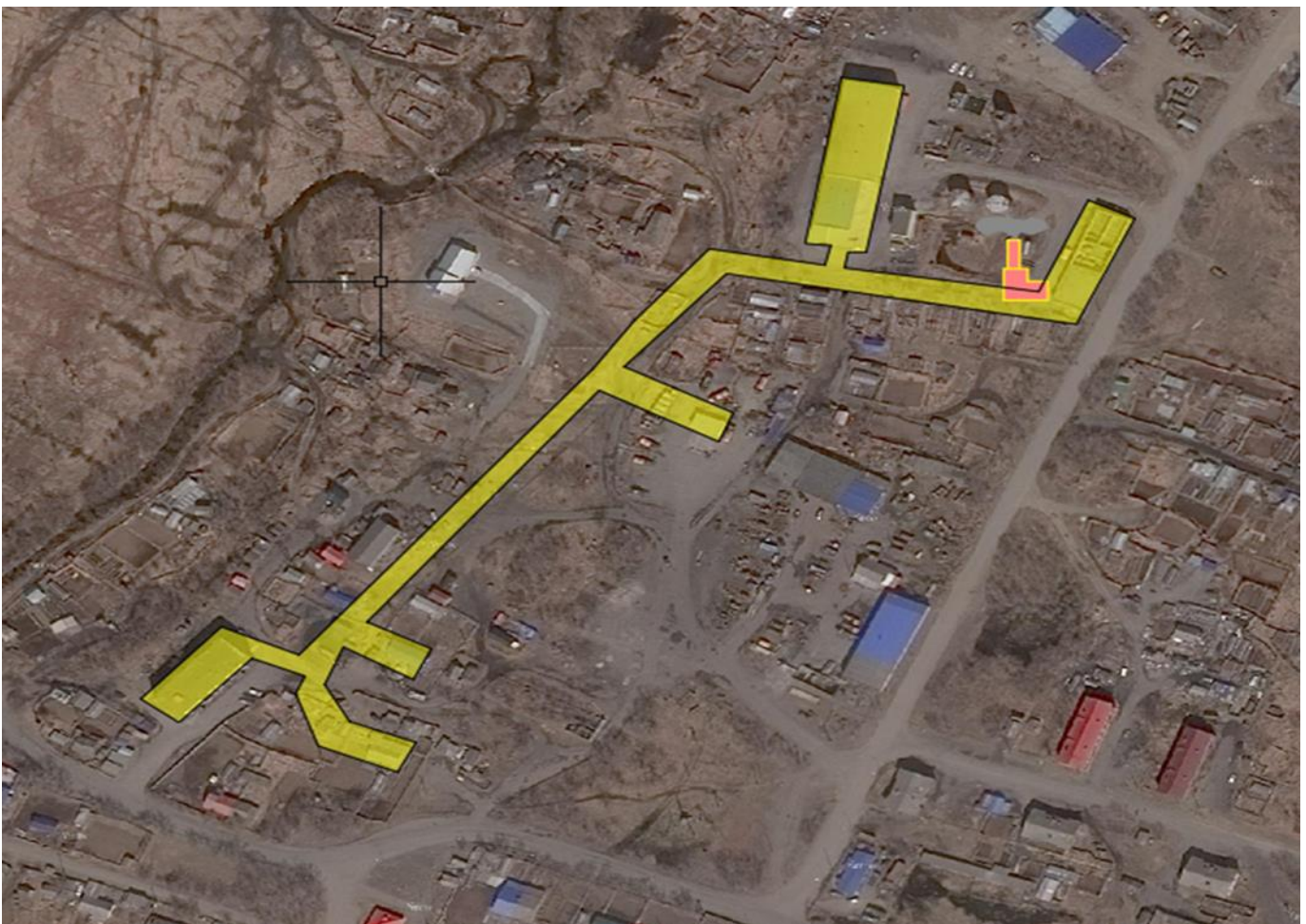
Рис. 1.3 – Зона действия ДЭС-10 – пгт Палана