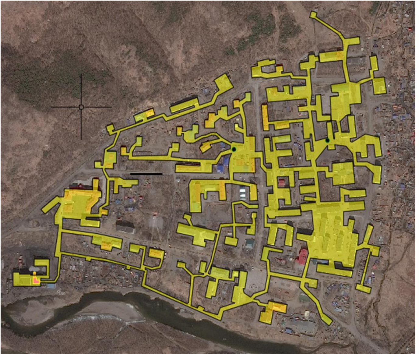
Рис. 1.1 – Зона действия котельной «Центральная» – пгт Палана